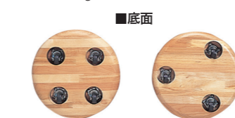
ターゲットストーン フロッカーストーン

¥148,280 (税抜価格¥134,800) ターゲットストーン1(グリーン)、フロッカーストーン6(レッド3、イエロー3)、収納バッグ1、メジャー1、ルール付 梱包サイズ: 52×45×28cm 重量: 約17kg