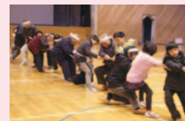
世代間交流綱引き大会