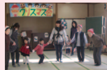
三世代ふれあい交流クリスマス会

子どもの見守り活動、世代間交流活動、昔遊びや絵本の読み聞かせ、地域の文化を伝える活動など