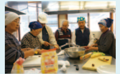
健康料理教室や男の料理教室など