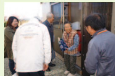
震災被災者に対する訪問活動(安否確認など)

友愛訪問、安否確認、話し相手、声掛け運動、ふれあい交流憩いの場(茶話会、サロン活動)など