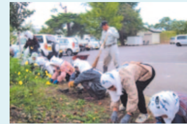
花のある町ゴミのない町、環境美化活動