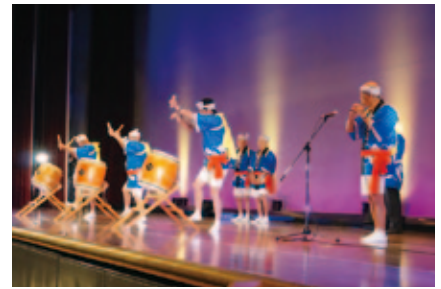
福島県高齢者芸能大会

私たちは、地域における高齢者自らの生きがい高め、健康づくりを進める活動やボランティア活動をはじめとした地域を豊かにする活動を展開しています。