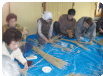
伝承活動(しめ縄づくり)