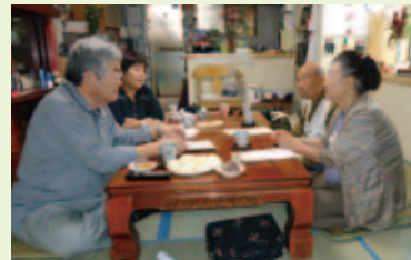
会員による友愛訪問活動(話し相手や声掛け運動)