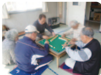
頭と指先を使う健康マージャン