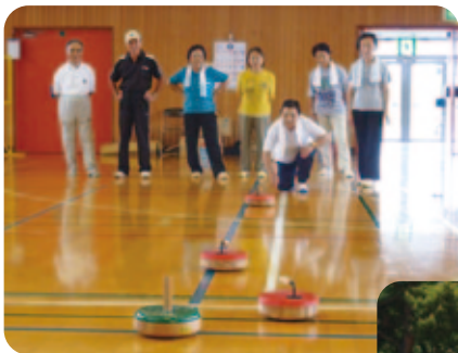
ニュースポーツ交流