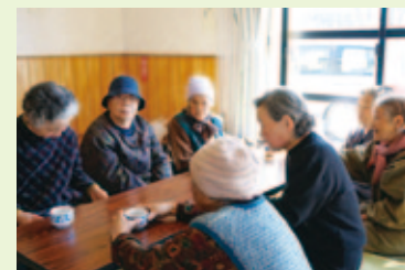
ふれあい交流憩いの場(茶話会やサロン活動)