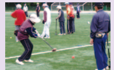
すこやか福島ねりんピック(グラウンドゴルフ)