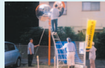
地域の安全を守る活動