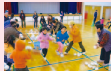
子どもたちの交流運動会