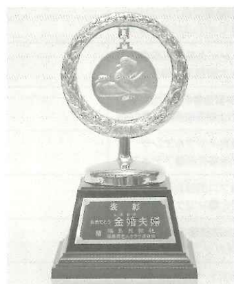
金婚夫婦に贈られるおしどり金メダル

結婚して50年、めでたく金婚式を迎えるご夫婦の皆様おめでとうございます。混乱期のりこえられ、ようやく暮しに明るさとゆとりを取り戻し、家族の絆を強くし夫婦が力を合わせ、県土復興に惜しみない労力を捧げました。また地域社会のリーダーとしても、大いに貢献されました。その労苦に報い、県民みなでご夫婦の金婚式を祝福し、賞状と記念の“おしどり金メダル”を贈るものです。